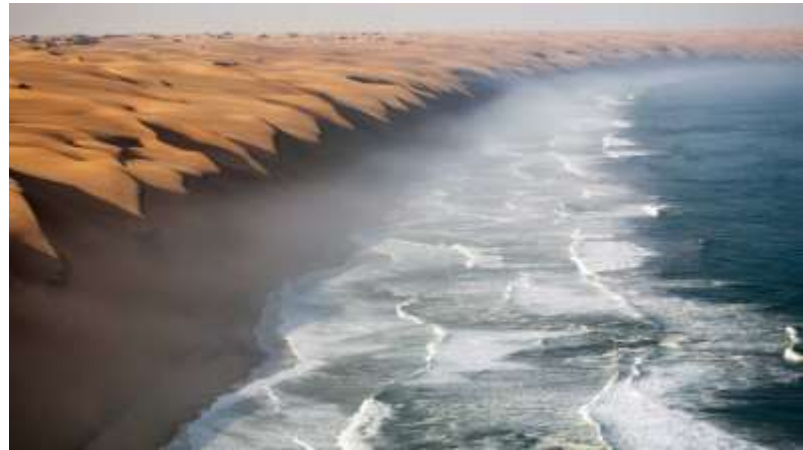
Advekcijaska magla uz obale pustinje Namib