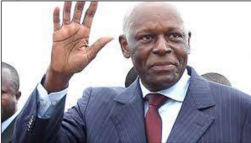
Jose Eduardo dos Santos, predsjednik Angole od 1979.

Izvor: http://www.cbsnews.com/news/the-worlds-enduring-dictators-jose-eduardo-dos-santos-angola-19-06-2011/