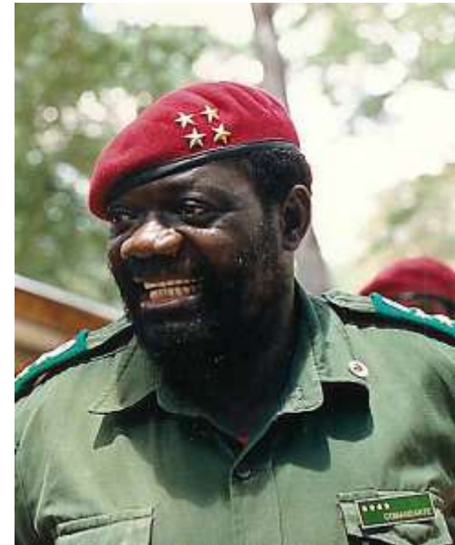
Jonas Savimbi, čelnik UNITA-e